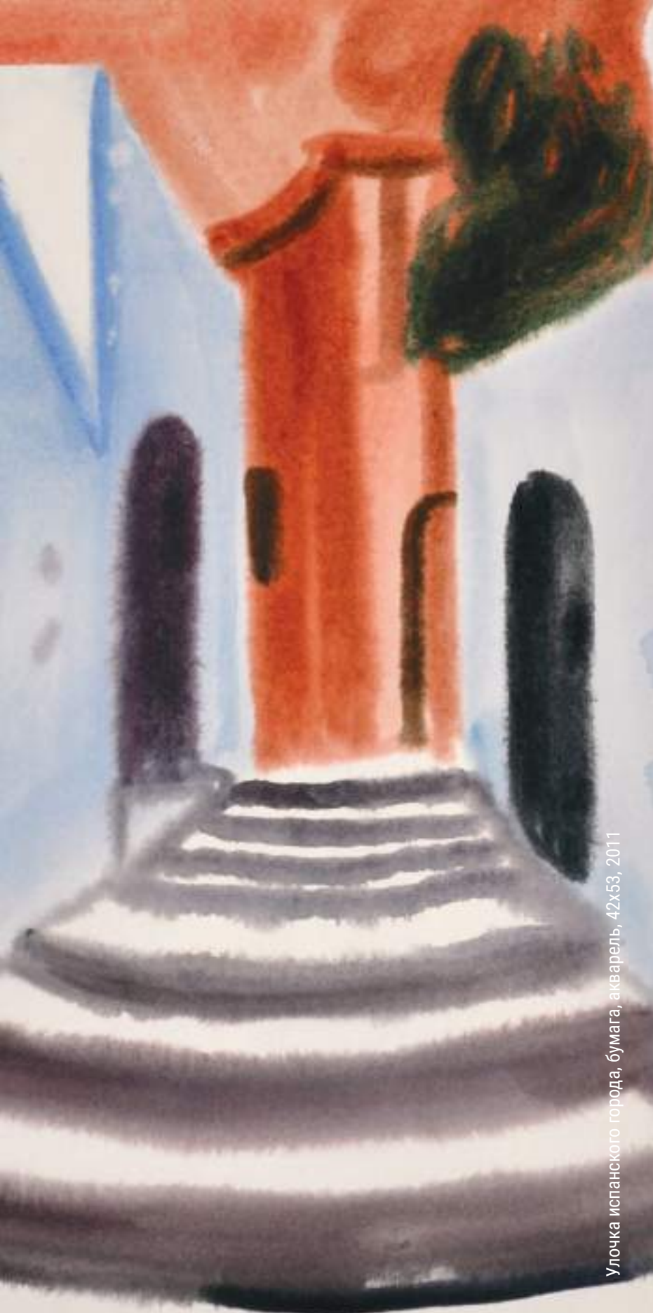
Улочка испанского города, бумага, акварель, 42x53, 2011