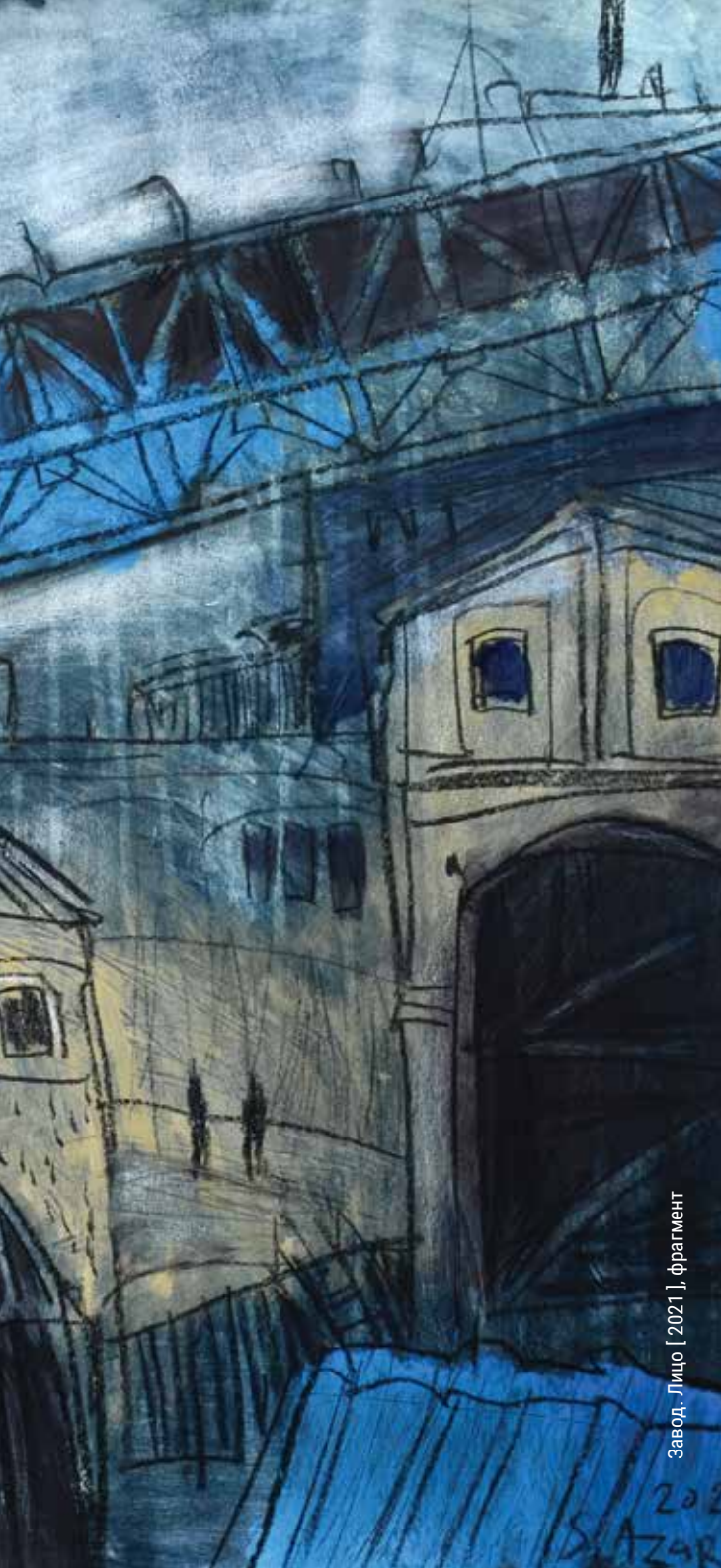
Завод. Лицо [ 2021 ], фрагмент